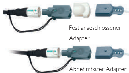
Fest angeschlossener Adapter

Über den Philips HeartStart Adapter können die SMART Pads II auch an Geräte anderer Hersteller angeschlossen werden.