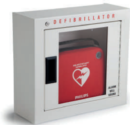
Geräteschrank für die Wandmontage, Basismodell Produktnummer 989803136531

Zur schnelleren Verständigung des Rettungsdienstes und der Verhinderung von Diebstahl bietet Philips drei verschiedene batteriebetriebene, alarmgesicherte Wandschränke. Das Basis-Schrankmodell verfügt über einen einfachen akustischen Alarm. Ebenfalls erhältlich sind zwei Premium-Schrankmodelle: Ein Geräteschrank für die Wandmontage und ein Einbau-Geräteschrank, der in einer Aussparung in der Wand für eine dezenteren Optik angebracht wird. Die Premium-Schrankmodelle verfügen über eine Kombination aus akustischem Alarm und blinkendem Alarm. Sie sind aus robustem, dickem Stahlblech gefertigt und bieten ausreichend Stauraum für optionales Zubehör. Der Alarm der Premium-Schrankmodelle kann außerdem mit Ihrem internen Sicherheitssystem verbunden werden, um eine koordiniertere Reaktion auf Notfälle zu ermöglichen.