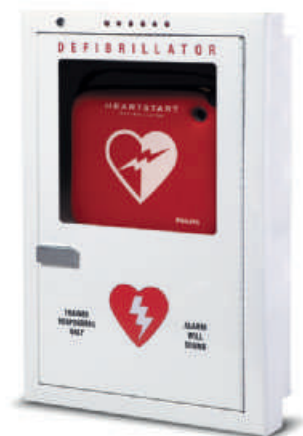
Einbau-Geräteschrank, Premiummodell Produktnummer PFE7023D

Abmessungen: 41 x 57 x 15 cm (B x H x T)