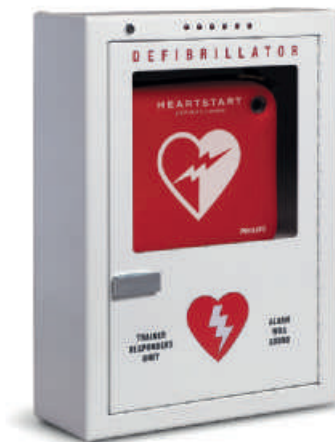
Geräteschrank für die Wandmontage, Premiummodell Produktnummer PFE7024D

Abmessungen: 42 x 38 x 15 cm (B x H x T)