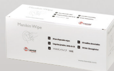
152400 oder 152401 Reinigungstücher (VE 50 Stück oder 1200 Stück)