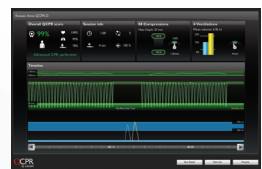
202-56050 RA Wireless SR Software 3 Lizenzen

Objektives Echtzeit-Feedback über Kompressionstiefe, -frequenz, Handentlastung und -position sowie zur Beatmung. Prozentuale Gesamtauswertung der CPR direkt nach dem CPR-Training möglich.