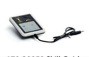
170-30050 Skill Guide