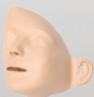
310210 Gesichtsteile (VE 6 Stück)