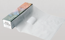
15120103 Übungsbeatmungstücher (VE 6 Rollen)