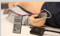
185-10050 ShockLink System

NEU! Der SimPad SkillReporter ist jetzt mit der optional erhältlichen Simulations-Software auch mit den SimPad fähigen ALS-Modellen und Simulatoren kompatibel. Weitere optionale Komponenten sind: