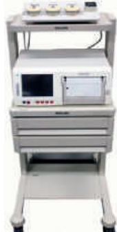
Avalon FM Gerätewagen mit Avalon CL Montagesatz