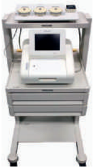
Avalon FM Gerätewagen mit Avalon CL Montagesatz